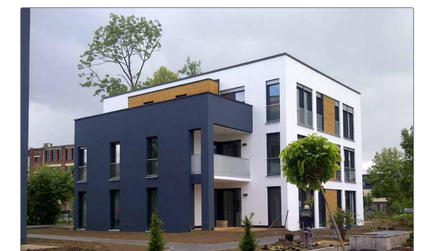
Rückbau - Neubau Beispiel: Bad Hersfeld - Wohnen am Schildepar/Dippelmühle