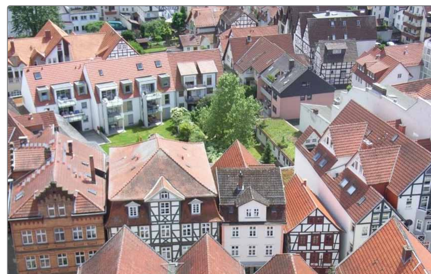
Anreizprogramm - grüne Innenhöfe Beispiel: Bad Hersfeld