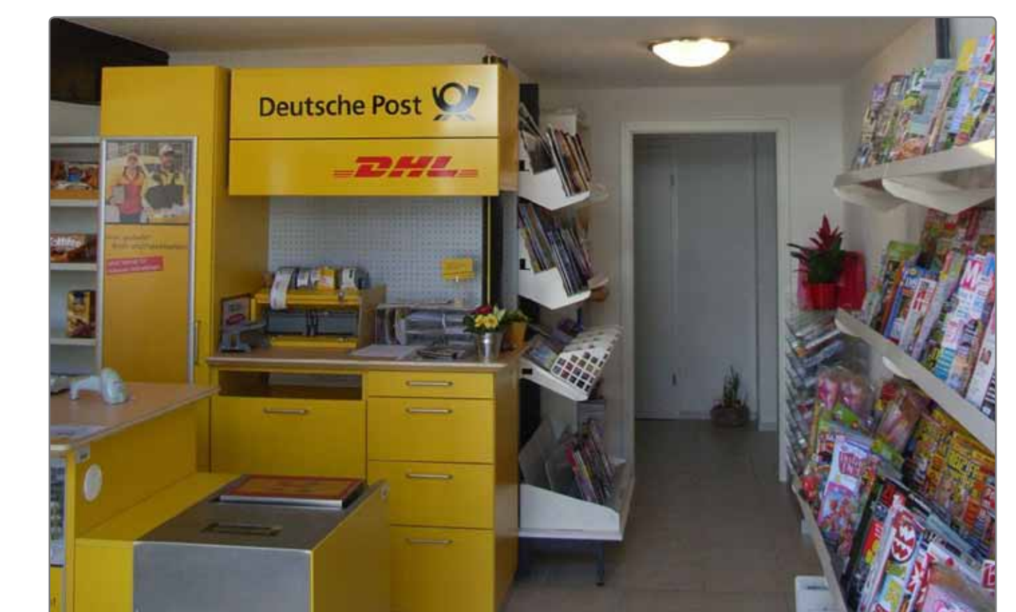
Einzelhandel im Altstadtgebiet unterstützen Beispiel: Diemelstadt