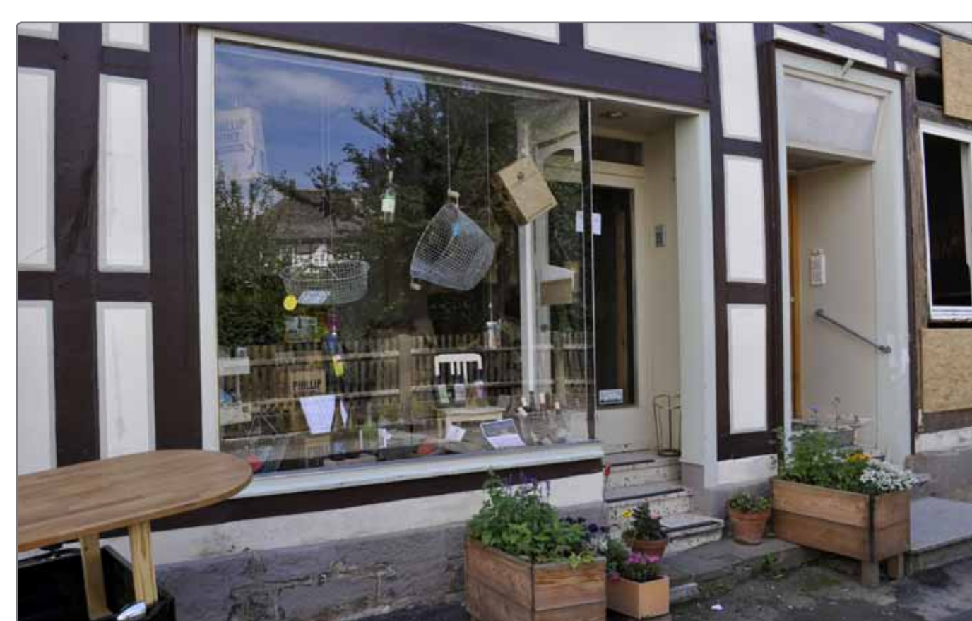
Temporäre und dauerhafte Nutzungen