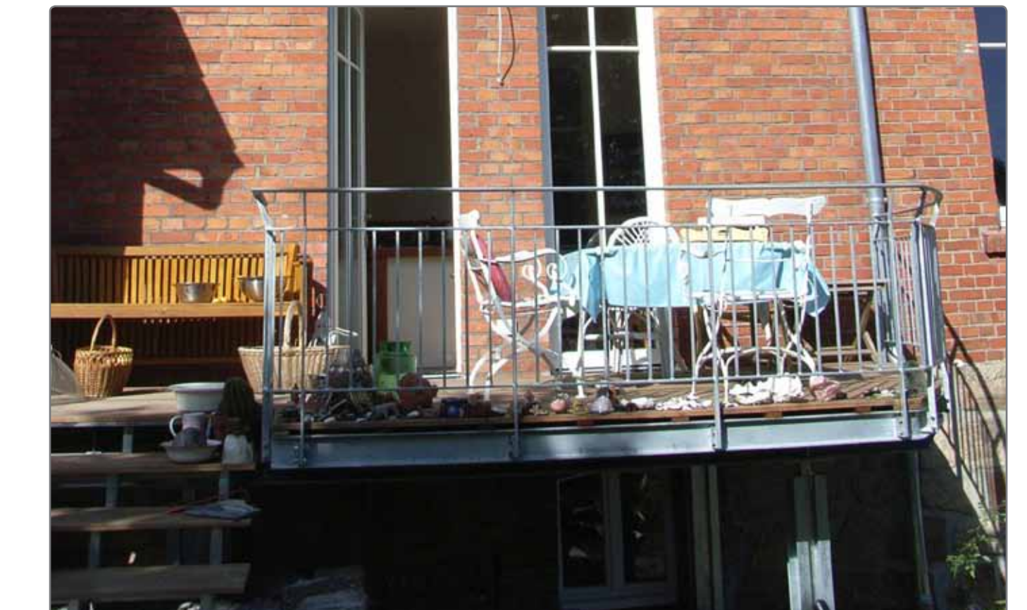
Förderung von Wohnumfeldmaßnahmen