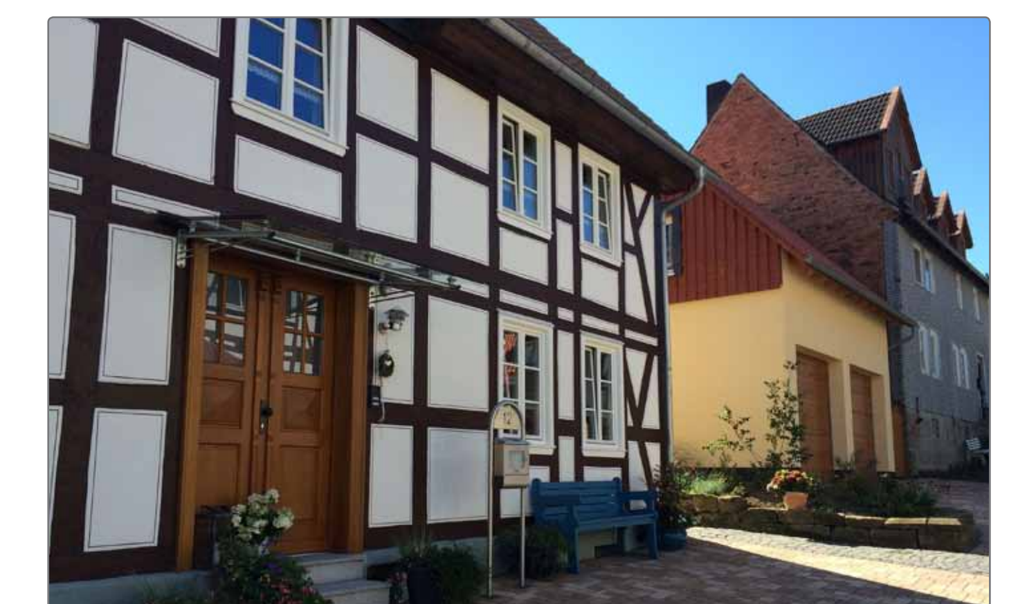
Anreizprogramm - kleinere Maßnahmen