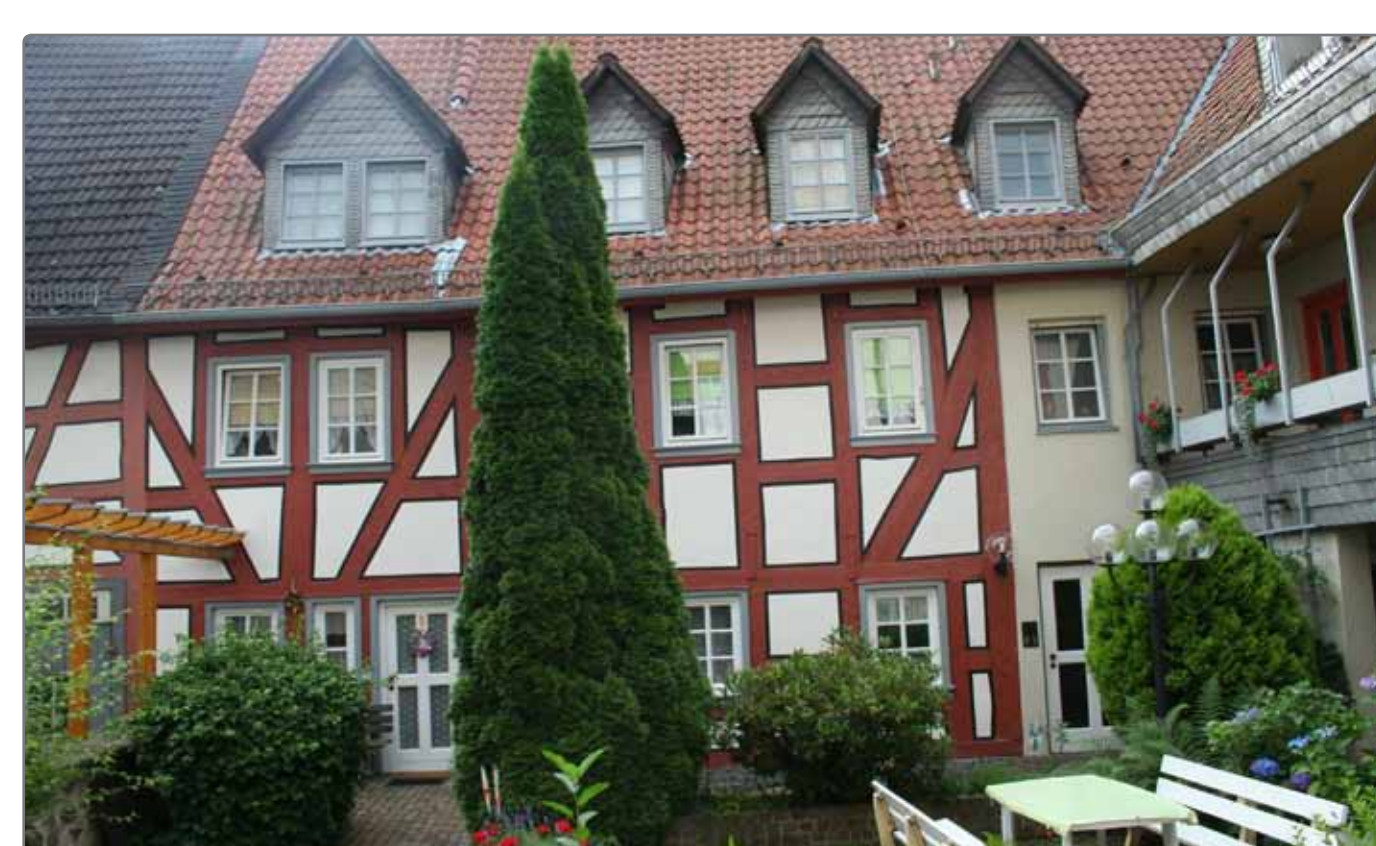
Wohnprojekte unterstützen Beispiel: Seniorenwohnanlage Alsfeld